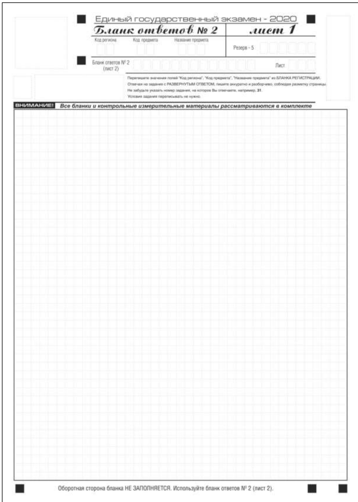
Рис. 10. Бланк ответов № 2 (лист 1)