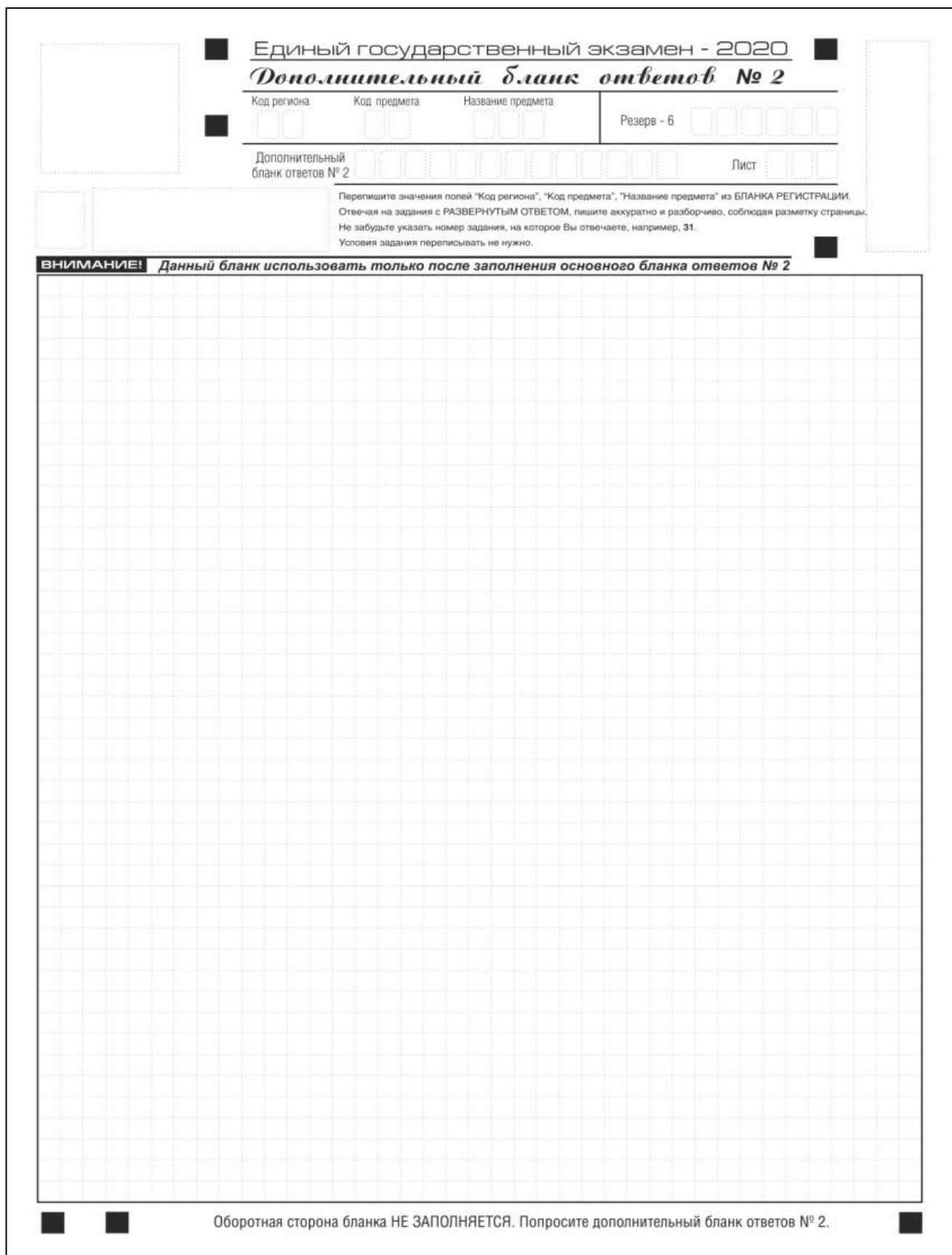
Рис. 15. Дополнительный бланк ответов № 2